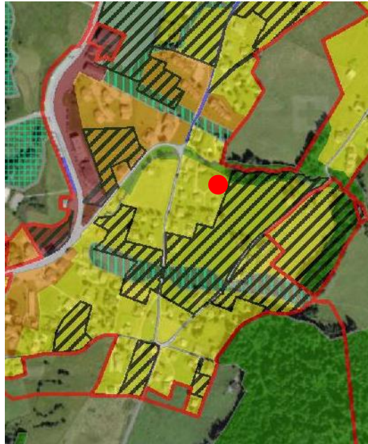
Extrait du plan d'affectation communal issu du guichet cartographique cantonal, échelle 1:10'000

Le Plan partiel d'affectation « Les Mosses – Plan des zones » de la Commune d'Ormont-Dessous a été approuvé par le Conseil d'Etat le 17 avril 1996.