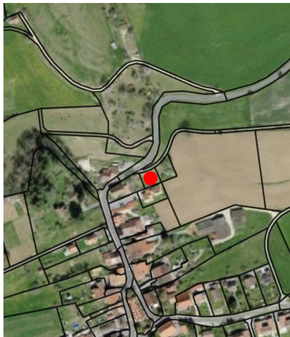
Plan de situation, échelle 1:5'000