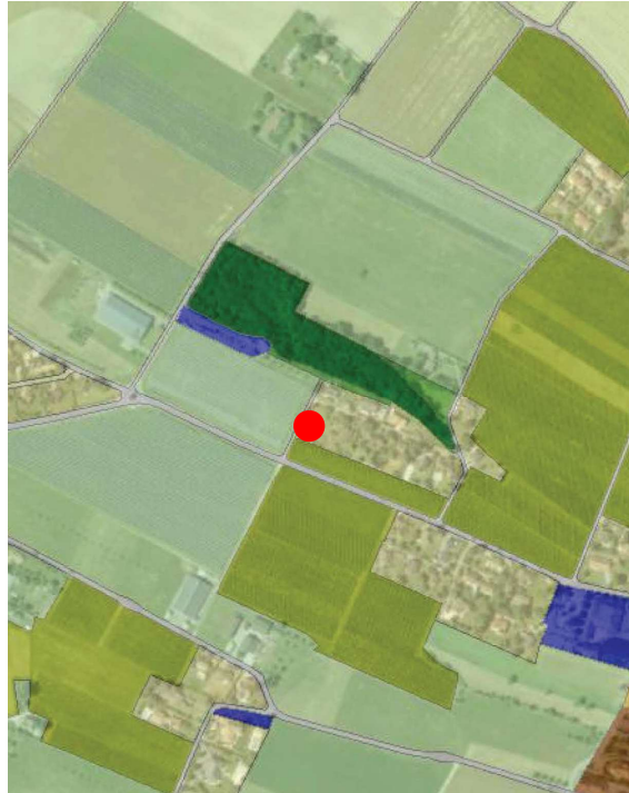
Extrait du plan d'affectation communal issu du guichet cartographique cantonal, échelle 1:10'000

Le Plan des zones de la Commune de Founex a été approuvé par le Conseil d'Etat le 22 août 1979.