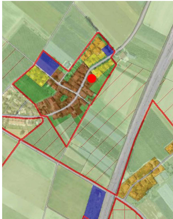
Extrait du plan d'affectation communal issu du guichet cartographique cantonal, échelle 1:10'000

Le Plan partiel d'affectation – aménagement du village de la Commune de Signy-Avenex a été approuvé par le Conseil d'Etat le 21 juin 1995.