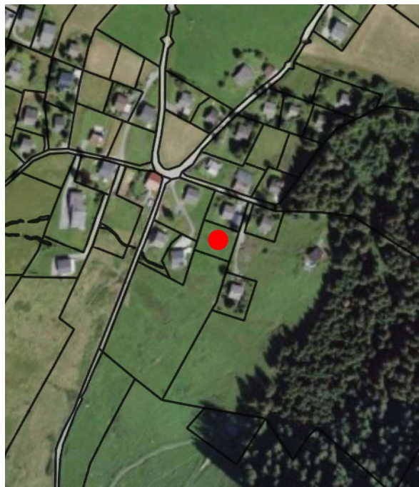
Plan de situation, échelle 1:5'000