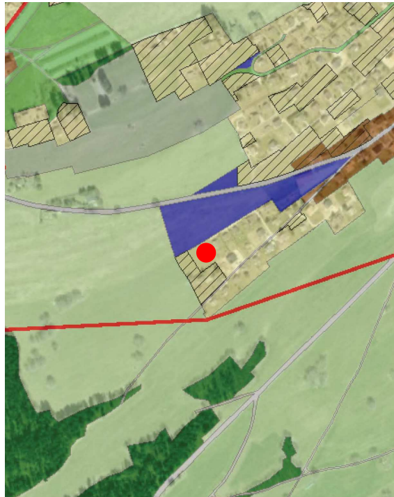
Extrait du plan d'affectation communal issu du guichet cartographique cantonal, échelle 1:10'000

Le Plan des zones de la Commune de Bullet a été approuvé par le Conseil d'Etat le 13 octobre 1982.