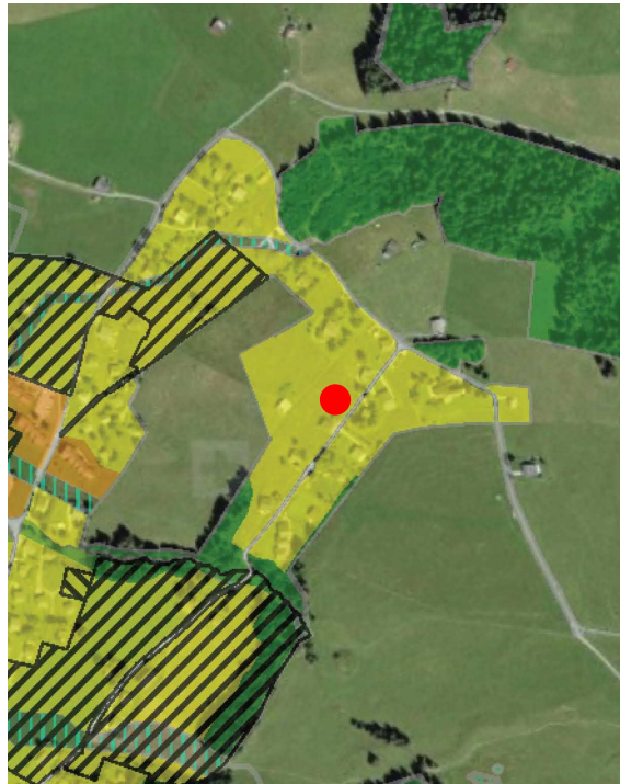
Extrait du plan d'affectation communal issu du guichet cartographique cantonal, échelle 1:10'000

Le Plan partiel d'affectation « Les Mosses » de la Commune d'Ormont-Dessous a été approuvé par le Conseil d'Etat le 17 avril 1996.