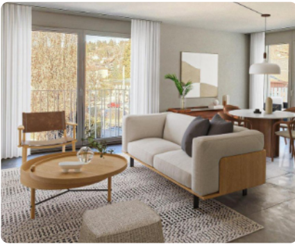
LADA à Epalinges

Il y a des LADA de 1,5 pièces, de 2,5 pièces ou de 3,5 pièces. Ces appartements sont regroupés dans un immeuble locatif. Il y a des espaces communs, dans l'immeuble ou à proximité, pour rencontrer d'autres personnes et participer à des événements.