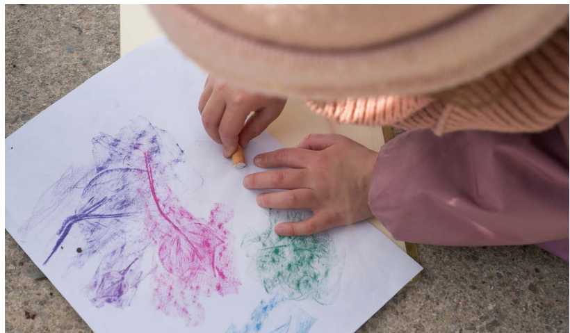
Projet "La culture, c'est classe!" 23-24: Une forêt pour cour d'école, Rosalie Gross et Anouk Déglon - EP Echallens-Emile Gardaz

Plus d'informations et inscription : ici