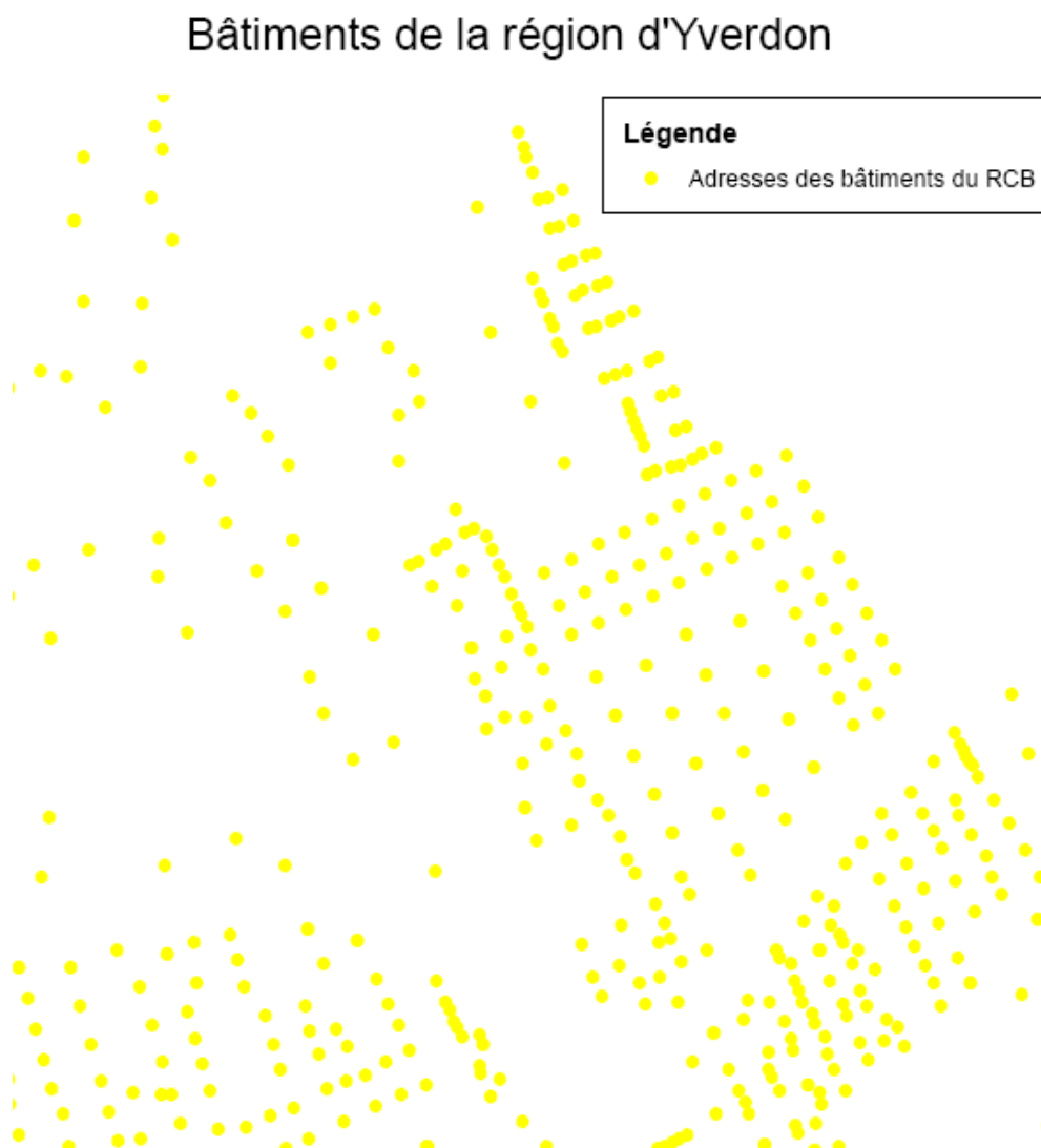
Figure 1: Modèle de représentation des adresses des bâtiments

Le modèle de représentation pour ce modèle de géodonnées minimal est relativement simple, sachant que les adresses des bâtiments sont représentées par des points jaunes sans bordures. Le système de coordonnées en vigueur est utilisé comme référence dans ce modèle de représentation. Un exemple d'expression graphique est présenté ci-dessous.