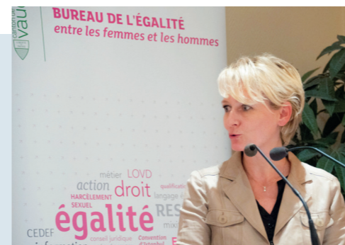
Isabelle Moret, Cheffe du DEIEP, 27 septembre 2022

En septembre 2022, la Commission cantonale consultative de l'égalité (CCCE) et le BEFH ont organisé le débat public « Quand les femmes (ne) prennent (pas) le pouvoir » consacré à l'accession des femmes aux organes de direction dans les entreprises privées. Quels sont les principaux obstacles à une plus grande présence féminine dans les directions d'entreprise? Comment se fait-il que l'accession des femmes aux organes de direction des entreprises soit plus difficile que dans les conseils d'administration? Que peuvent faire les entreprises pour encourager les candidatures féminines? Faut-il adopter des mesures spécifiques? Autant de questions qui ont pu être abordées par un panel composé de représentant-e-s de l'académie et de l'entreprise.