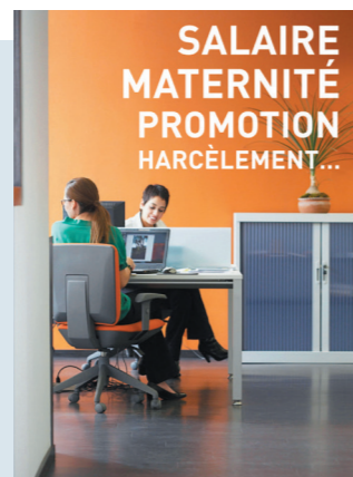
Couverture de la brochure «La loi sur l'égalité vous protège, Mode d'emploi pour comprendre la loi et faire valoir vos droits», BEFH, troisième édition, décembre 2017

En décembre 2022, le BEFH a organisé un débat avec des spécialistes du droit et des ressources humaines afin de promouvoir la mise en œuvre de la loi fédérale sur l'égalité entre les femmes et les hommes (LEg) dans le canton de Vaud. Bien que cette loi soit un outil important pour lutter contre les discriminations dans le monde du travail, la LEg reste encore largement méconnue. Destiné aux spécialistes des ressources humaines et de l'ordre judiciaire, le débat a permis d'examiner différentes situations concrètes.